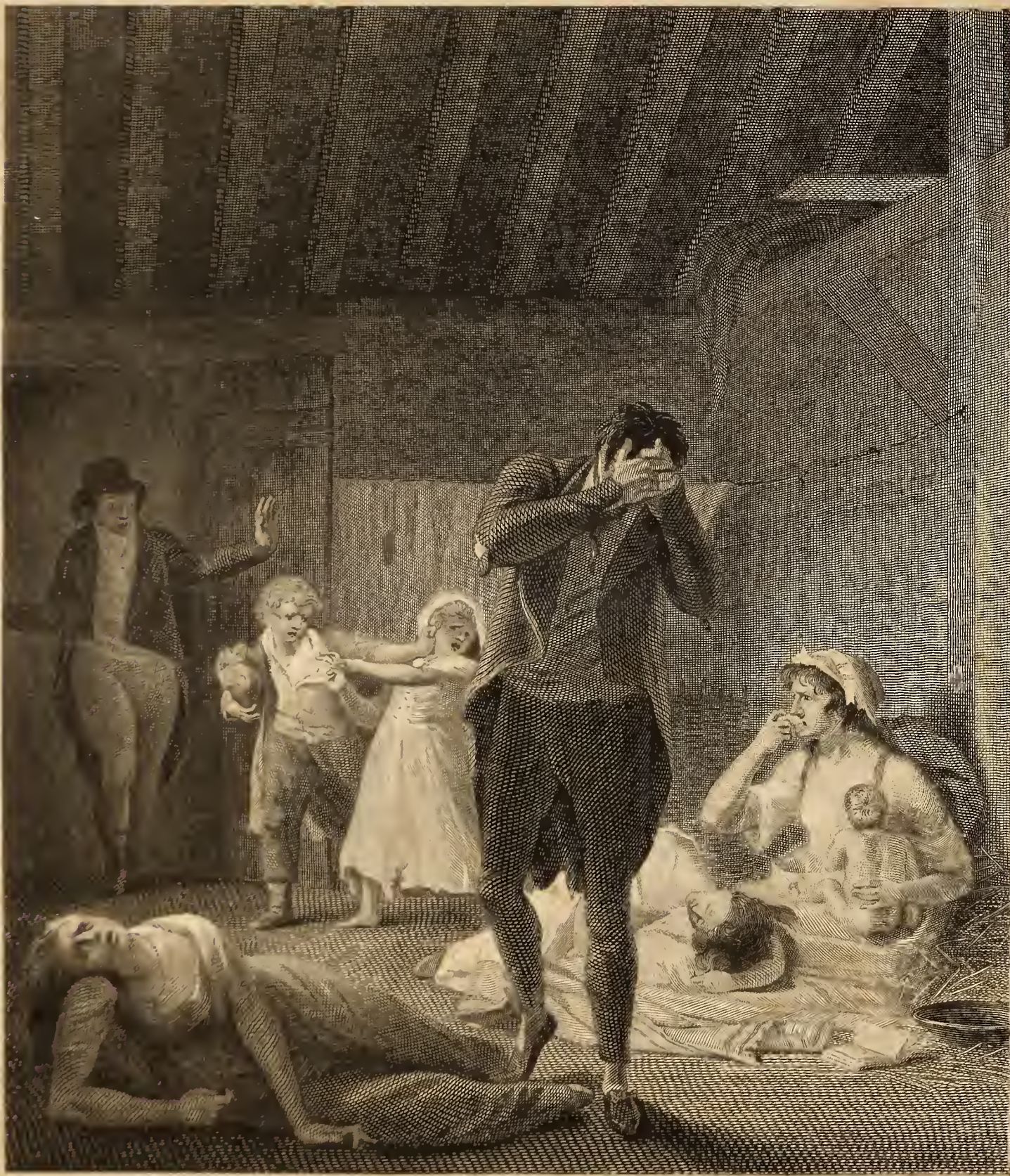
Guari par P. Audouin d'après une esquisse de H. P. Dantoux.